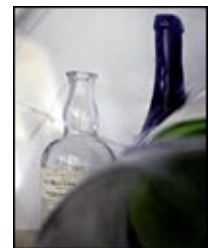
O cotidiano visto pelas lentes de Bel Pedrosa